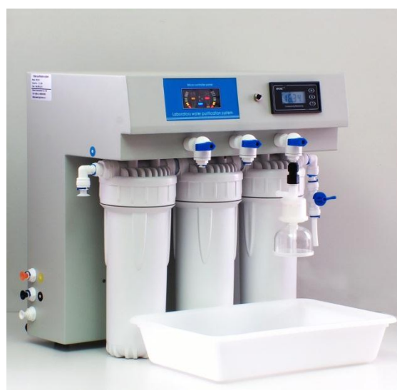
2: Uređaj na stolu