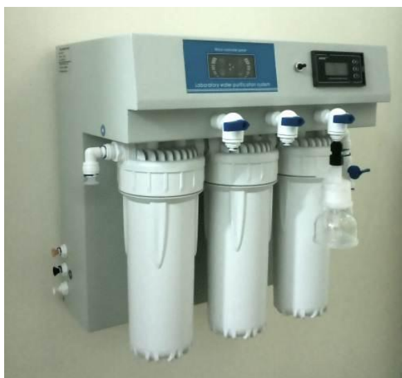
1: Uređaj na zidu